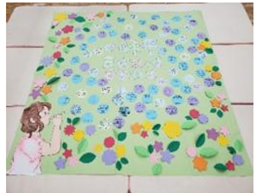
金町学童保育クラブ 平和のシャボン玉