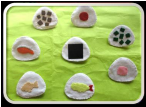
デイサービスセンターすこやか おむすび神経衰弱ゲーム