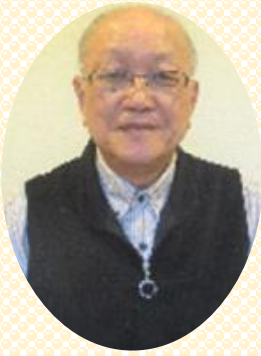
すこやか福祉会を支援する会